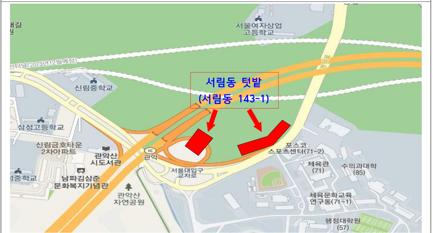
▲ 서림동 텃밭 (서울대 정문 앞)