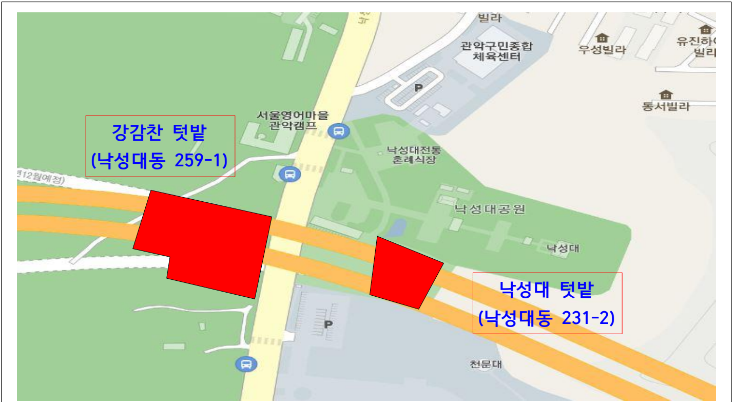
▲ 강감찬, 낙성대 텃밭 (낙성대 공원 인근)